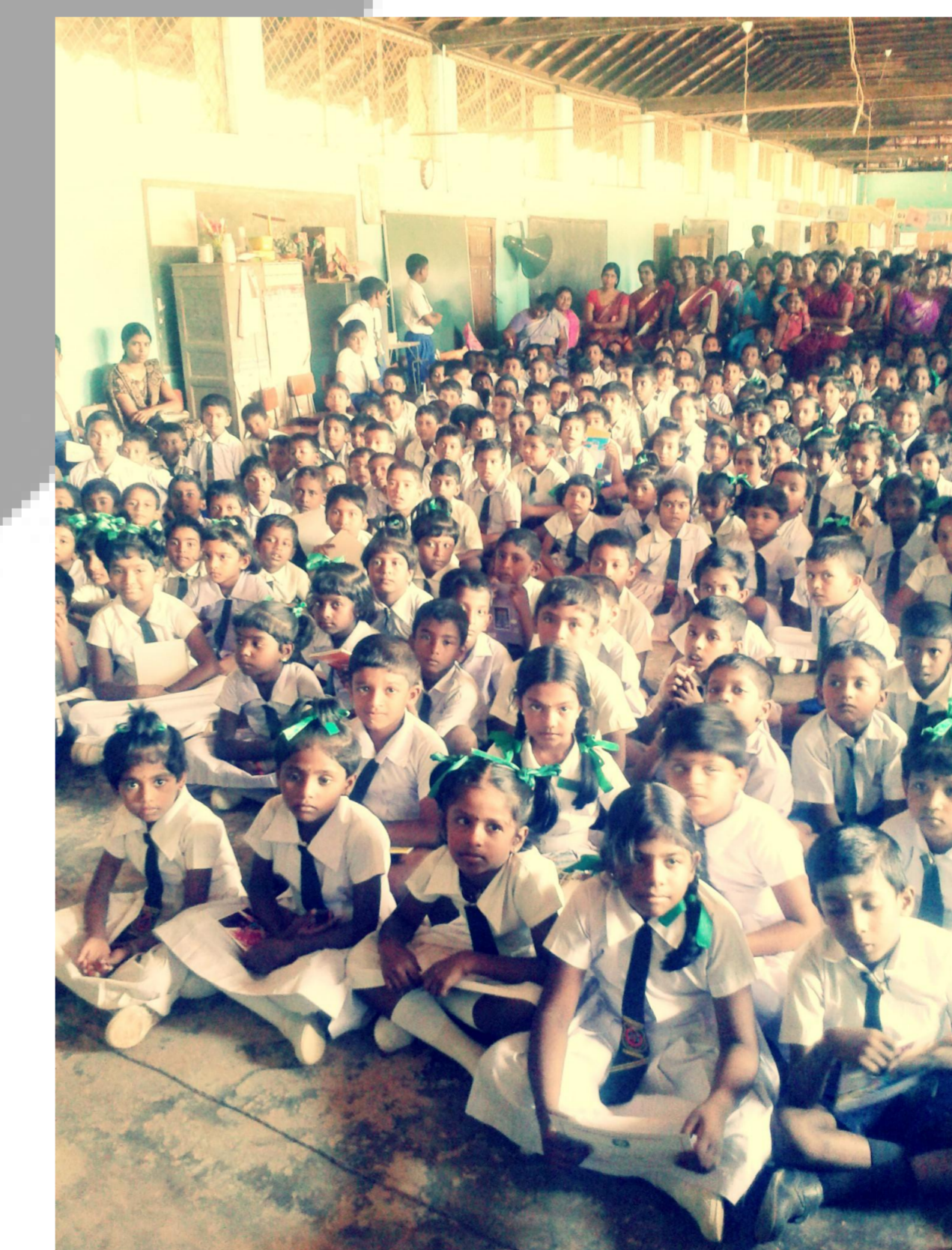
Schüler einer unterstützten Schule bei der Zeugnisausgabe