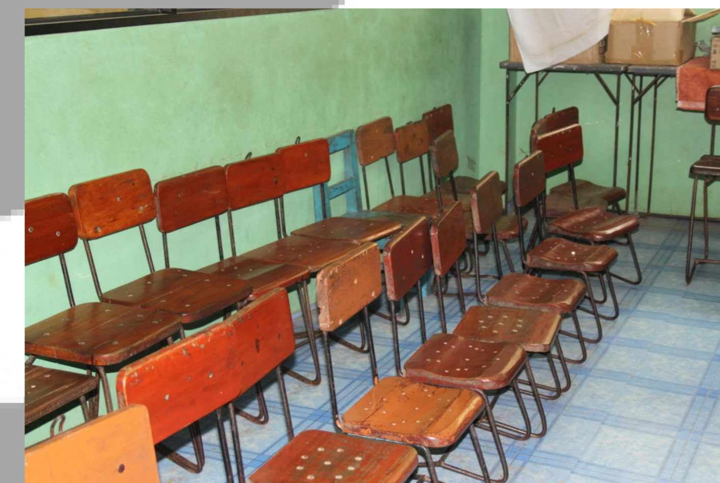
Finanzierte Möbel - jetzt können die Kinder richtig lernen