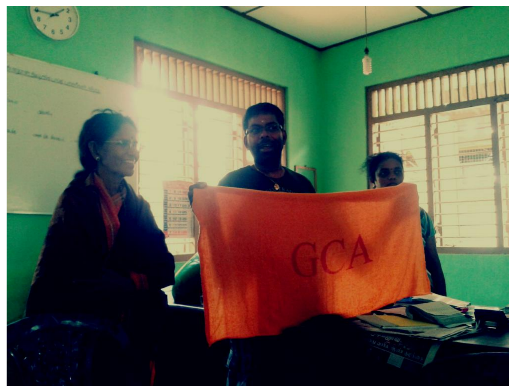
GCA Mitglied bei der Arbeit vor Ort in Sri Lanka

Ein besonderes Augenmerk wird dabei auf den Heimatort der Gründer der Organisation, Sri Lanka, gelegt. Des Weiteren werden aber auch andere hilfsbedürftige Länder unterstützt, die zum Beispiel durch Naturkatastrophen, wie ein Erdbeben, verwüstet worden sind.