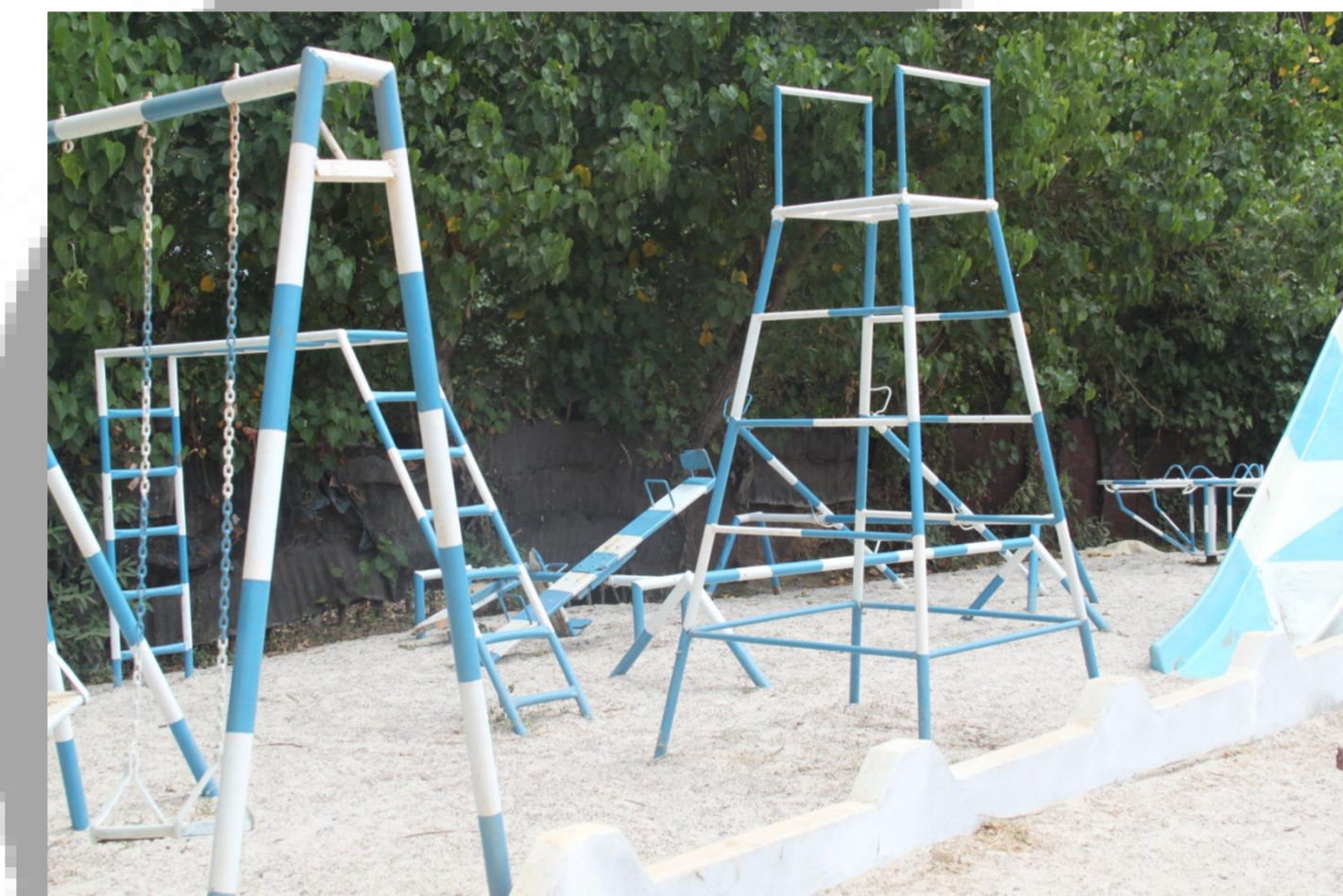
Von GCA erbauter Spielplatz an einer Schule in Jaffna

2014 spendete GCA einer weiteren Schule in Jaffna eine Wasserleitung, damit fließendes Wasser in der Schule vorhanden ist.